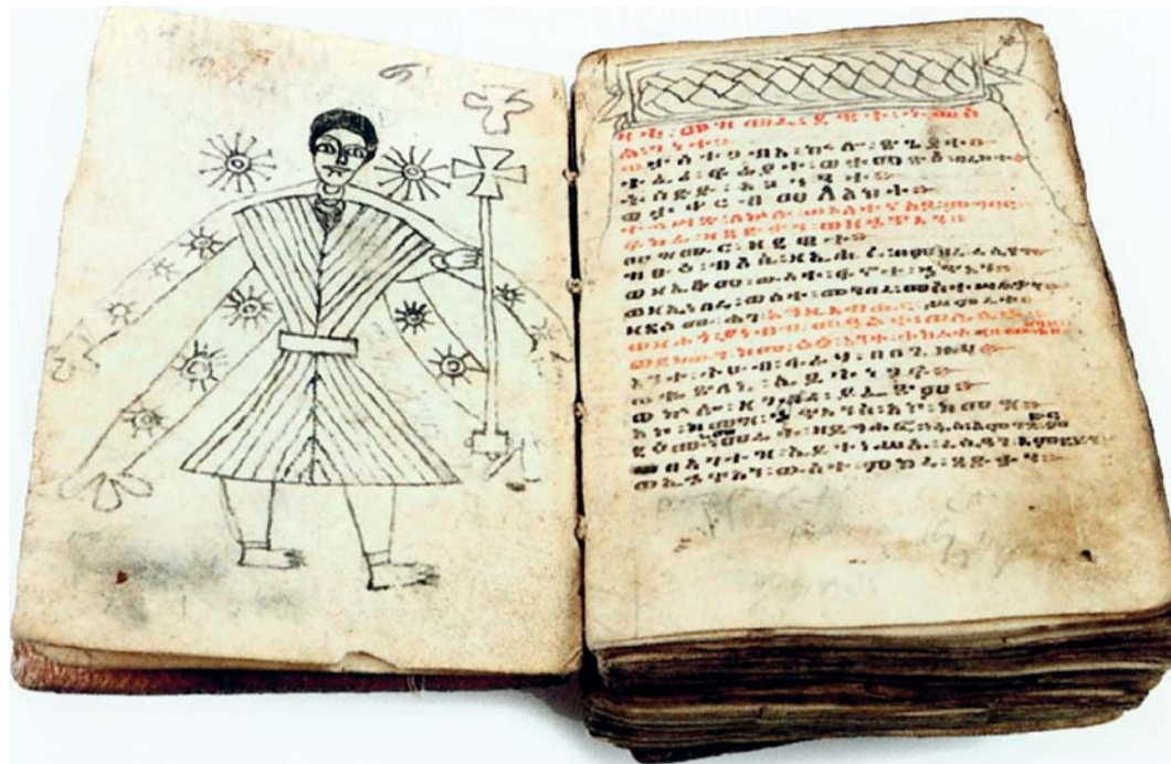
Amharsky psaná Bible z Etiopie konce 19. století ukazuje archanděla Michaela jako přemožitele Antikrista.