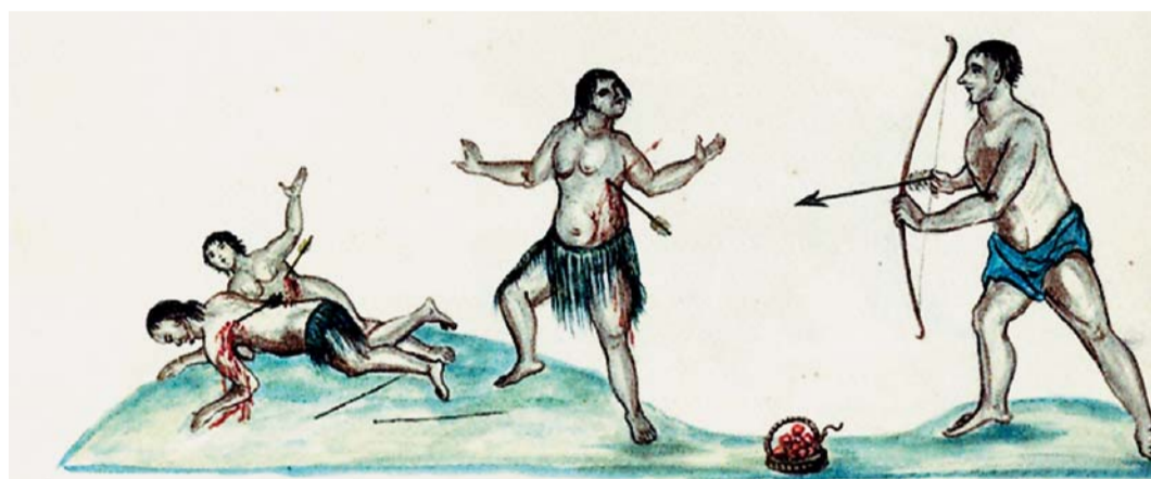
Autorem vyobrazení boje mezi kalifornskými indiány je český jezuitský misionář P. Ignác Tirsch (†1781). Jeho rukopis je dnes uložen v Národní knihovně v Praze.

ztvární aranzmá cínových vojáků z 1. poloviny 20. století. Výjev z let dobývání Mexika (1519–1521) sestává z pyramidy připomínající tenochtitlánský Templo Mayor a z mužů v obřadních aztéckých oděvech, jak obětují zajaté španělské vojáky. V roce 1521 přitom Hernán Cortés nakonec Aztéckou říši vyvrátil, jak víme mj. z líčení františkánského misionáře P. Bernardina de Sahagúna (†1590), a před Templo Mayor vyrostla metropolitní katedrála.