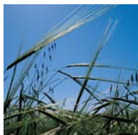
V Izraeli dodnes divoce roste oves a ječmen. V biblických dobách tvořil ječmen hlavní součást stravy chudých.

T éměř veškerá zemědělská produkce v Izraeli souvisela s bezprostřední obživou. Lidé vypěstovali právě tolik, aby uspokojili potřeby své vlastní rodiny. Tento scénář mnohdy narušovaly nespolehlivé dešťové srážky a častá sucha; zdroje potravin také trvale ohrožovaly kobylky a další škůdci – stejně jako nájezdy loupeživých vojsk.