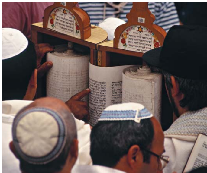
Ortodoxní židé u Západi zdi v Jeruzalémě čtou během svátku svitky Tóry.

Nejtypičtějším židovským svátkem je šabat („sobotní den“). Narodil od ostatních svátků se neslaví jednou v roce, ale opakuje se každý týden. Sedmý den v týdnu byl podle Božího přikázání uvedeného v Písmu oddělen jako den naprostého odpočinku pro lidi i jejich zvířata. V tento den si