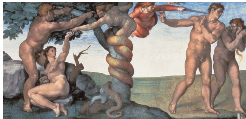
Hlavní patronkou umění v tehdejší Evropě byla církev. První hřích a vyhánění z ráje (Michelangelo Buonarroti, 1508–12, freska na stropě Sixtinské kaple ve Vatikánu).

HELEN DE BORCHGRAVE, CESTY KŘESŤANSKÉHO UMĚNÍ