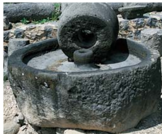
Čedičový lis na olivy v Kafarnaum. Olivy se vkládaly do prohlubně ve spodním kameni. Horní kámen se otáčel pomocí držadla připevněného do otvoru uprostřed.

okurky, pórek, cibuli a česnek, které jedli v Egyptě. V Izraeli byla nabídka místní zeleniny omezenější a značné oblíbené se zde těšila čočka a fazole. Pokud